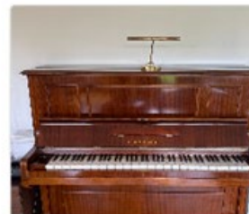
Klavier, Marke C.Bechstein

gut erhaltenes und unterhaltenes Qualitätsklavier, typisch weicher "Bechstein-Klang"; 2022: Mechanik angepasst; letzte Revision/Reparatur: Nov. 1999 (Alter: ca. 100 Jahre)